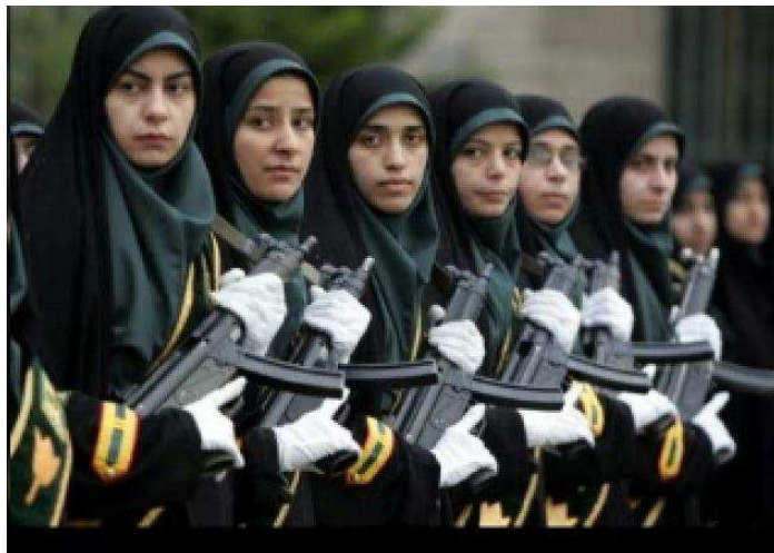
Mulheres Islâmicas – 2006